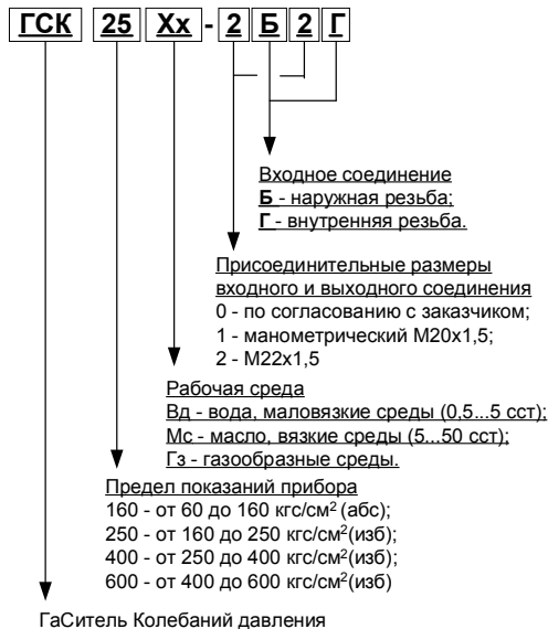
Рисунок 1.1 – Условное обозначение гасителей колебаний давления

Расшифровка обозначений гасителей, показывающая рабочее давление измеряемой среды, вид исполнения и присоединительные размеры, представлена на рисунке 1.1.